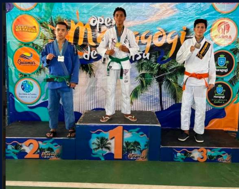
Os meninos do jiu-jitsu têm se destacado nas competições, subindo ao pódio e adquirindo experiência competitiva.