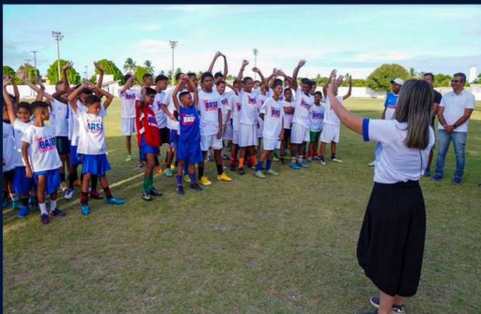
O programa na base do futebol